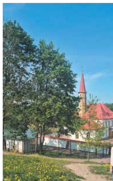
Приоратский дворец в Гатчине

Ближайшее заседание областной комиссии по ИИ, на котором утвердят дорожную карту, намечено на начало следующего месяца.