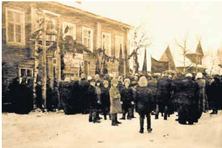
Изба-читальня "Красный пахарь"

Комсомольцы задумались над тем, как дальше строить