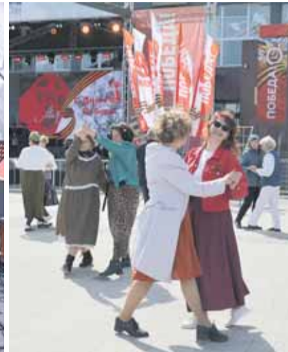
Начало на 2-й и 5-й стр.

Горожане, отдавшие дань памяти у памятника Воину-Освободителю, смогли отдохнуть, послушать песни военных лет и современные композиции, посвященные Победе, и разделить радость праздника друг с другом. Праздник стал днем единства, памяти и благодарности. Он напомнил всем, что подвиг поколения победителей жив, пока мы помним, чтим и передаем память дальше.