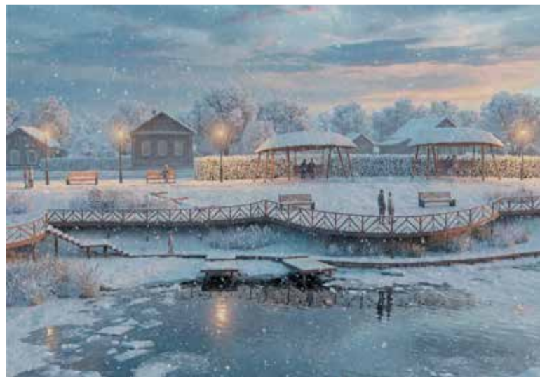
Проект по благоустройству набережной реки Тихвинки, созданный студентами Санкт-Петербургской академии им. А. Л. Штигица