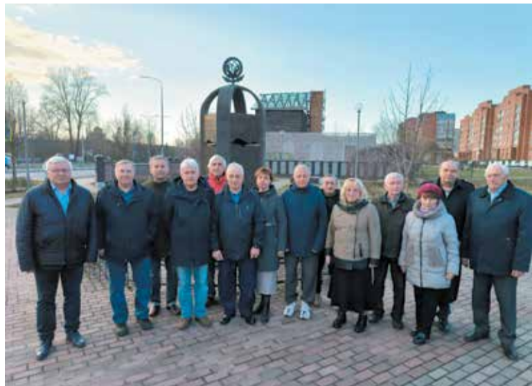
Члены правления Сосновоборского отделения Союза «Чернобыль» у мемориала Ликвидаторам ядерных аварий и катастроф в Сосновом Бору