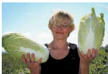
На рассаду выращивайте в кассетах — лучше приживётся после пересадки.

комендована для диетического питания при сердечных заболеваниях и язве желудка. Для восточноазиатской капусты пригодны любые плодородные почвы. Культура влаголюбива, устойчива к пониженным, вплоть до 0°, температурам. Учитывая, что период вегетации составляет всего 40–50 дней, эту капусту можно сеять в парнике в конце второй декады апреля. В возрасте трёх недель ей пора в огород.