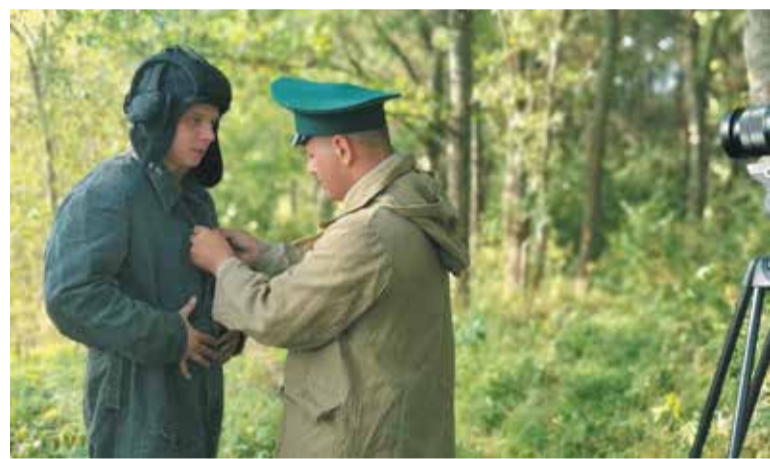
Фото со съёмки фильма «Война и мир лесничего Антипова»